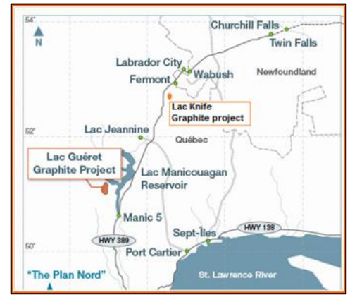
Figure 2 : Localisation des dépôts du Lac Guéret et du Lac Knife. (Modifiée de Mason Graphite, 2013).

Le principal enjeu reste au niveau de l'exploration afin de découvrir des gîtes ayant les bonnes caractéristiques physiques et chimiques. La présence de quelques indices dans la région du Saguenay-Lac-Saint-Jean indique un certain potentiel de découverte. Cependant, les efforts de prospection devront être intensifiés pour arriver à localiser de meilleurs gîtes .